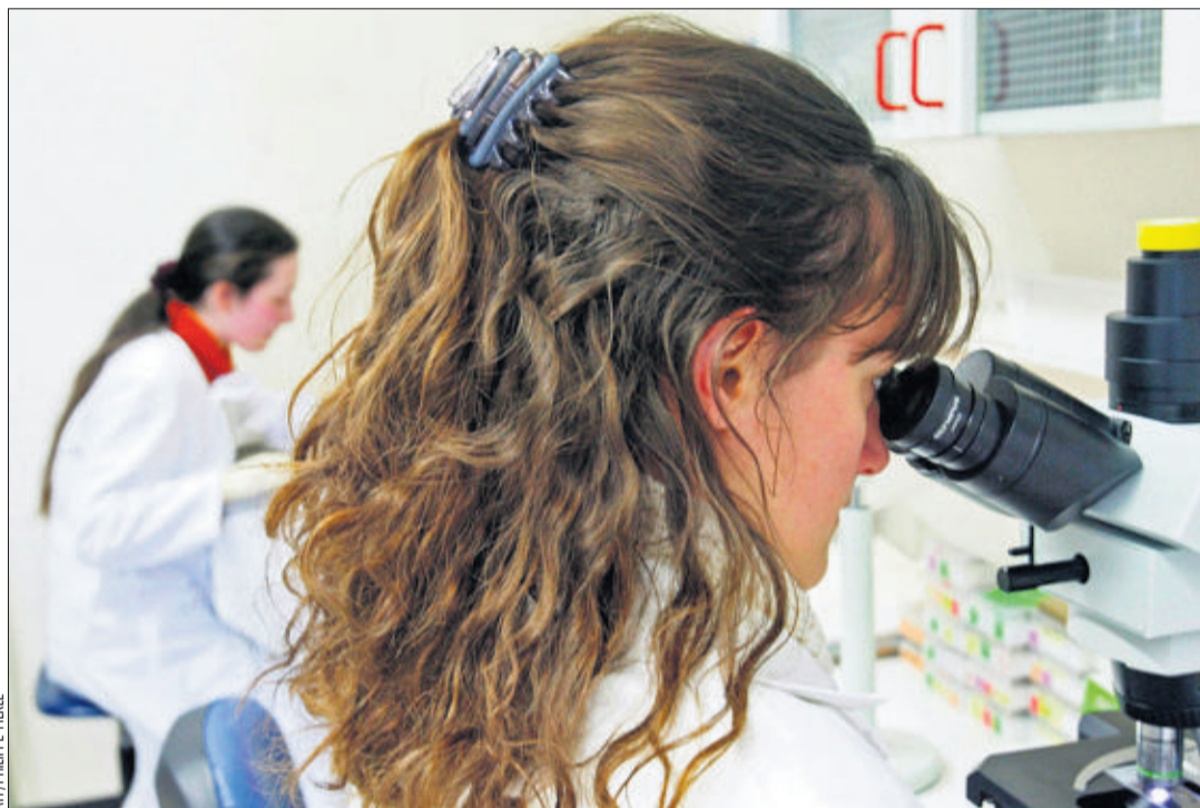
LABORANTIN Son travail consiste à isoler, purifier, analyser ou synthétiser diverses substances pour des projets de recherche ou pour le développement de produits chimiques.

«J'ai adoré le fait de pouvoir comprendre, s'enthousiasmer la laborantine. Ma responsable de formation m'expliquait chaque manipulation, son déroulement et son utilité. Aucune question n'était sans réponse. Il y a beaucoup à apprendre et le niveau d'exigence est assez élevé. Mais